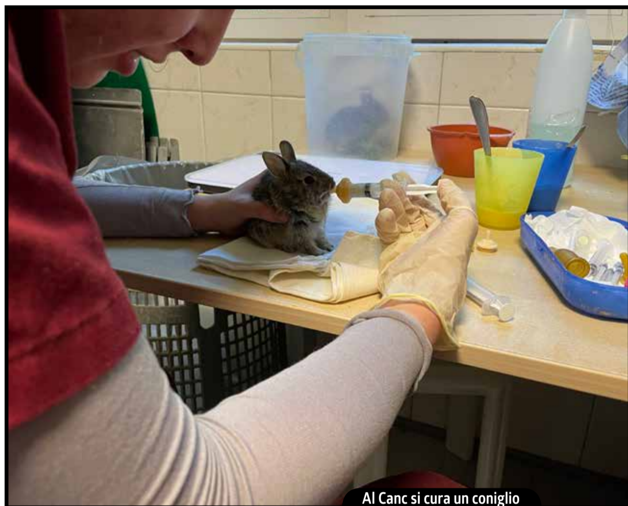
Al Canc si cura un coniglio