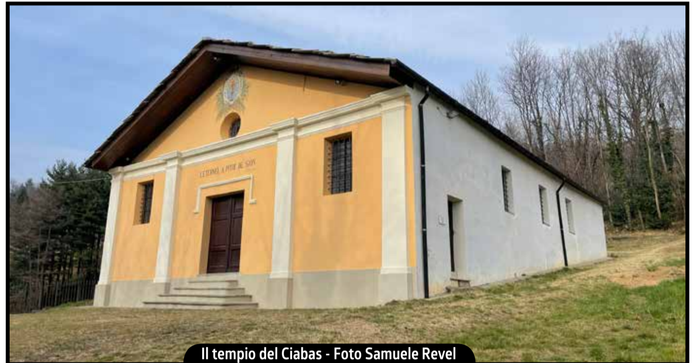
Il tempio del Ciabas

La sera, nelle borgate delle valli valdesi, la riunione serve a discutere di Bibbia, storia, temi di attualità