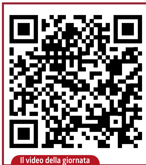
Il video della giornata

Il mondo che entra in un piccolo museo di provincia. «Grazie agli scambi di volontariato internazionale ho avuto modo negli anni di conoscere tanti giovani, ognuno con le sue passioni. Ho imparato ricette estere, ho cercato di studiare il tedesco e molto altro». Curiosità, altruismo. Doti che consentono di andare incontro al prossimo senza pregiudizi. E al prossimo dedicare tempo e cura.