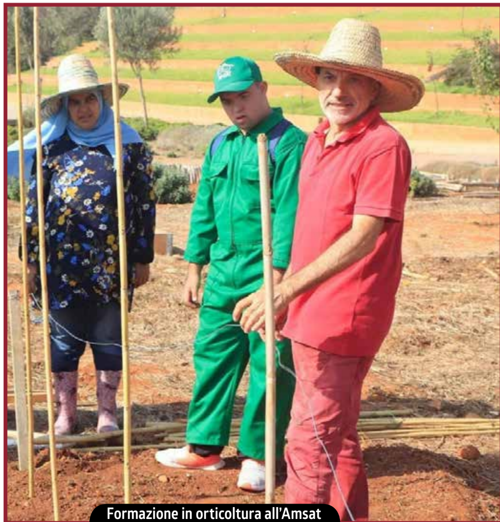
Formazione in orticoltura all'Amsat